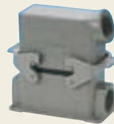
アングル型フードと結合時の写真