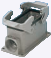
中継用固定台座(2レバー式)